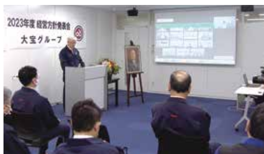
経営方針発表会(TV会議使用)