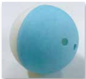
PIM 製トイカプセル (サンプル)

大宝グループは1995年に、プラスチックにかわる成形材料の開発に着手し、長年培ってきたプラスチック成形加工技術との融合を目指してきました。パルプ射出成形は、主成分にパルプと澱粉を用いた成形材料を射出成形して、3次元立体構造物を実現する新技術です。