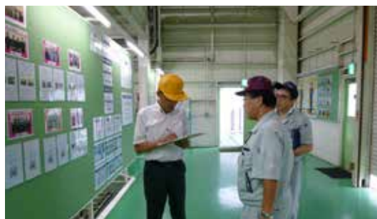
湖南工場サーベイランス審査

また環境表彰制度を設けており、特に環境管理活動で優れた事業所には表彰を行っています。